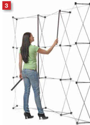
3 Mount the mag-bars...