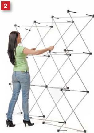
2 Snap up the framework, making sure to attach all the magnet connectors.