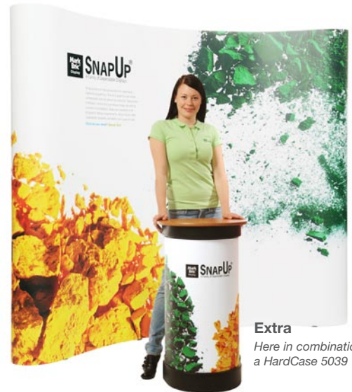
Extra Here in combination with a HardCase 5039