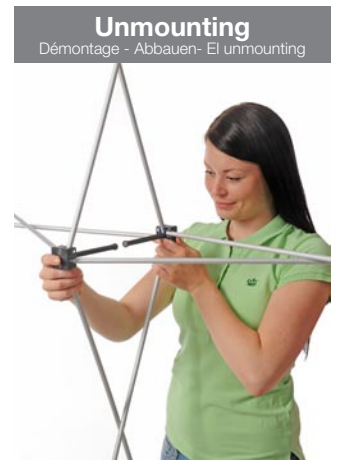
Unmounting Démontage - Abbauen- Ei unmounting