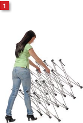
1 Grip the framework at the second row from the top.