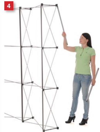
4 ...also at the last colimn at the backside.