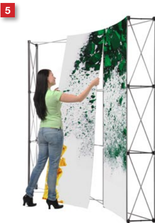
5 Mount the front panels.