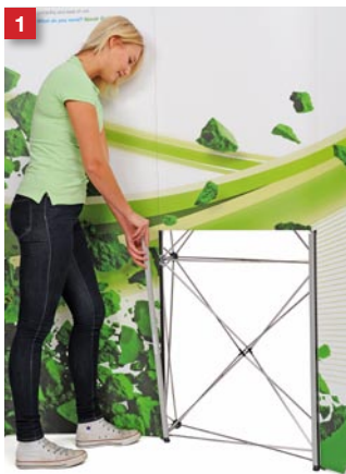
1 With wall graphics in place, attach the two T-bars on each edge of the table opening.