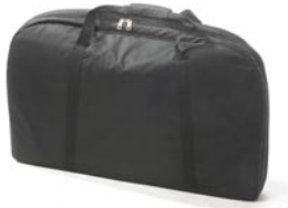
Extra Bag for table attachment Item IS-80-TB05