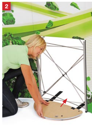
2 Slide the bottom shelf into position.