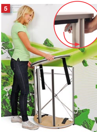
5 Attach the top shelf on top of the T-bars and front posts and lock the FASTclamp.