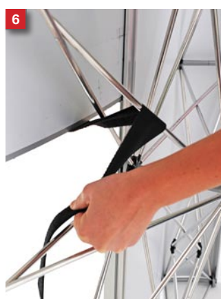
6 Wrap & lock both velcro bands around the diagonal struts of the display wall-- Under the front strut and over the back strut.