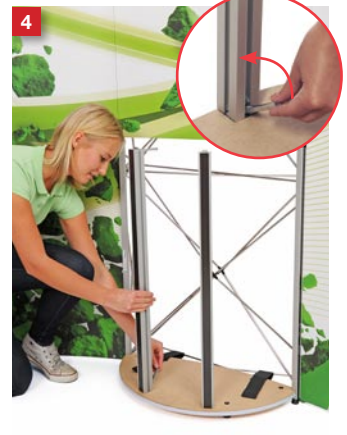
4 Mount the two front posts and lock the FASTclamp.