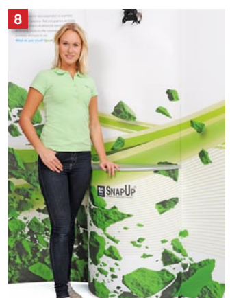
8 You are ready!