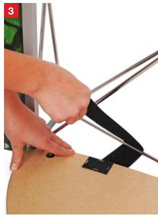
3 Wrap both velcro straps around the bottom horizontal struts of the display wall.