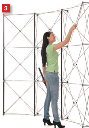
Mount the mag-bars...