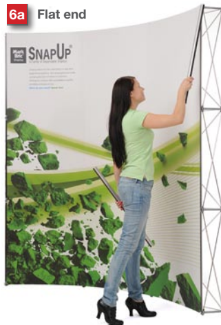
Attach 3 "Corner trims" in each corner.