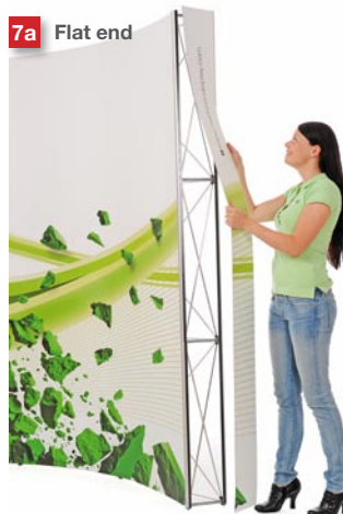
Mount the end panels.