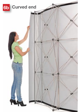
Wrap the end graphic around the corner.